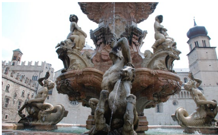
Sotto a sinistra gruppi scultorei nella fontana del Nettuno a Trento, realizzati dallo scultore trentino con la pietra statuarina di Arco. A destra una delle statue colossali poste sul ponte sul fiume Taro a Parma, opera in pietra statuarina di Arco.