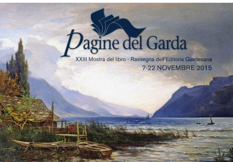
Manifesto della Rassegna con un quadro proprietà della Cassa Rurale Alto Garda

L'impegno dell'autore è stata innanzitutto quello di illustrare la storia delle cave di pietra statuaria che sono dentro quel bosco, andando alla ricerca di alcune statue che con quella pietra sono state realizzate nel corso dei secoli. Egli si è soffermato su alcune creazioni artistiche, documentate, che testimoniano l'importanza di quelle cave. Le opere più celebri ricordate nel libro sono le quattro statue colossali