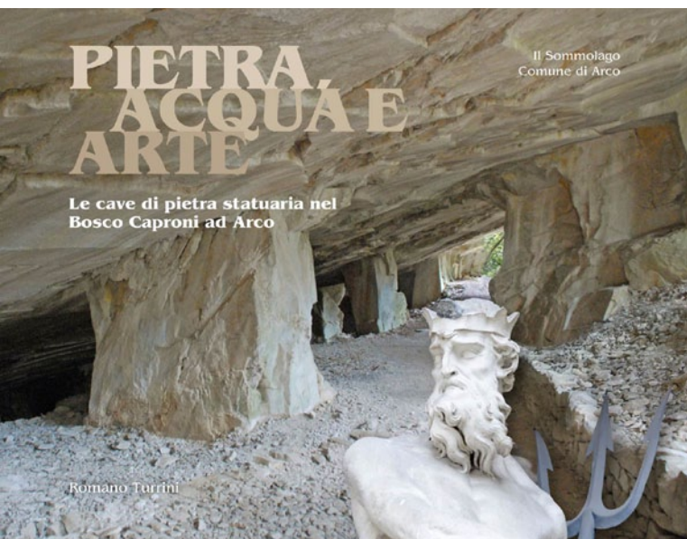
Copertina del libro "Pietra, acqua e arte"

che sono collocate alle estremità del ponte sul fiume Taro a Parma e i gruppi scultorei nella fontana del Nettuno in piazza Duomo a Trento.